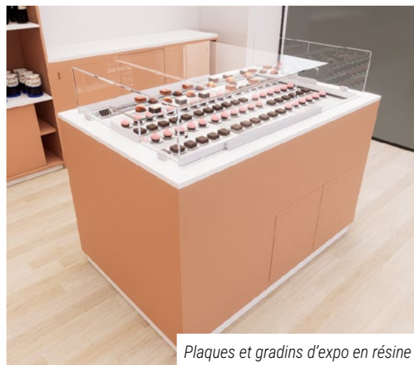
Plaques et gradins d'expo en résine

Les mensualités douces à partir de 473 € HT/mois sur 36 mois*