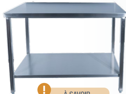
Table inox centrale avec étagère basse